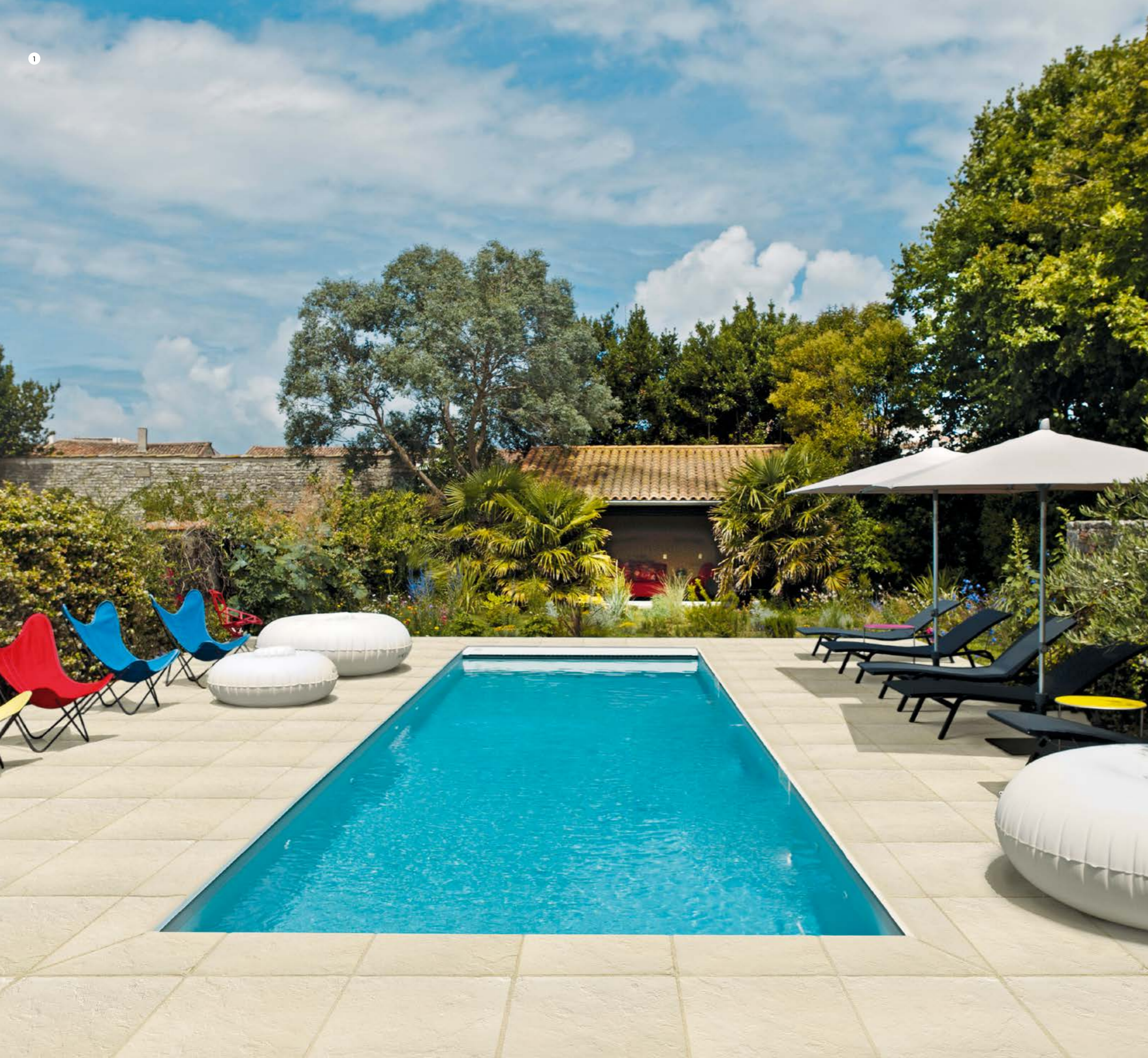
Dalle et margelle Romance, teinte Luberon ①